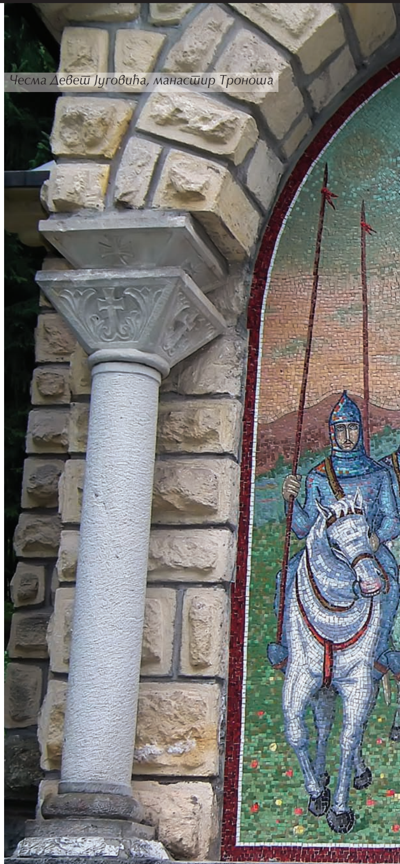
Чесма Девеи Југовића, манастир Трноша

ких пјесама од старине, но будући да је она премјена тако силно ударила у народ, да су готово све заборавили што је било донде, па само оданде почели наново приповиједати и пјевати“. Можда је брутално насиље „кадро да створи просторне празнине, избрише стара сећања и промени менталне категорије и веровања“.