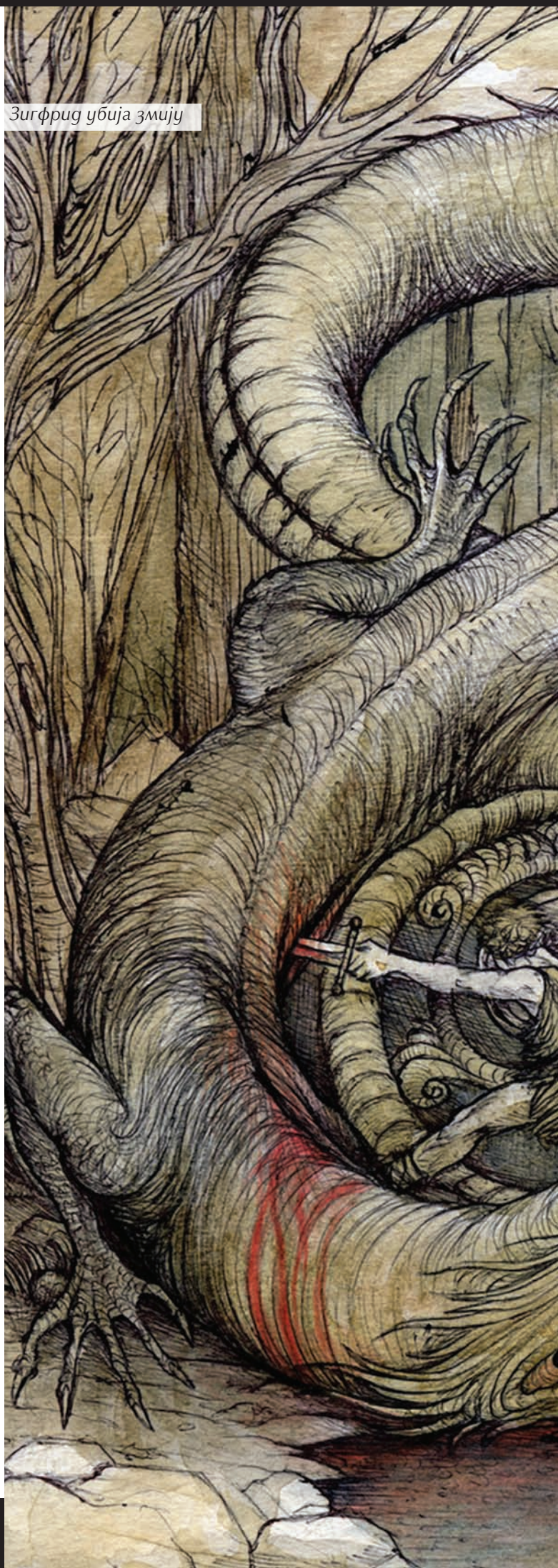
Зигфрид убија змију

У друштву које се припрема за рат, објективна казивања о прошлости, сатканој од победа и пораза, успона и падова, ратничких врлина и кукавичлука, уступају место митској причи која на ту и такву историју баца сасвим нову светлост. Из прошлости заједнице израњају само величанствени тренуци славе, пркос предака, понос ратника и слава јунака. „Из фонда објективних научних, филозофских и историјских сазнања, у митске приче уносе се само они појединачни елементи који служе појачавању уверљивости митских фабула.“