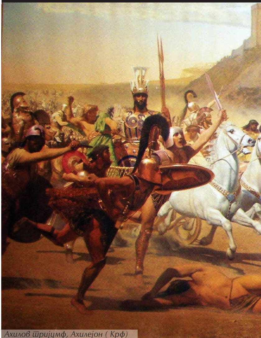
Ахилев тријумф, Ахилејон (Крф)

Људи вероватно не би могли да поднесу истину о страхотама ратовања када не би стварали величанствену слику хероја. Мит о јунаку изражава сва надања једног народа у победу над омраженим непријатељем. Митски јунак постаје морални узор и извор снаге. Његове особине импонују аудиторијуму који, углавном, некритички и готово хипнотички, слуша приче и песме о јуначким подвизима. Група се неретко поистовећује са јунаком, коме придаје оне особине које сматра неопходним одговором на егзистенцијалне изазове стварности. Јунак покреће на акцију, али може стварати и привид, за самопоштовање, често, тако потребне борбе.