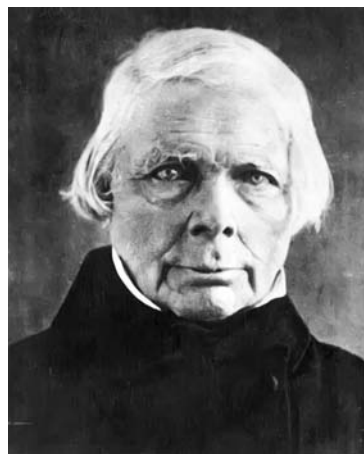
Фридрих Вилхелм Јозеф Шелинг